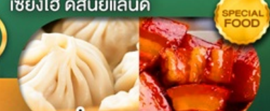
พิเศษ เสี้ยวหลงเป่า หมูตงพอ เดินทาง ม.ค. - มิ.ย. 69