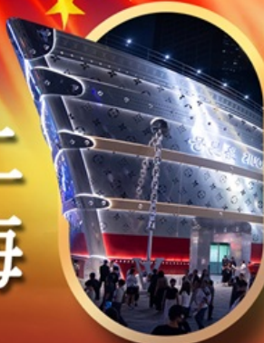
เรือคอะหลุยส์