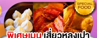
พิเศษเมนูเสี่ยวหลงเปา หมุดงพ้อ ไก่จอกาน เดินทาง ม.ค. - มิ.ย. 69