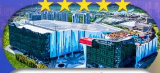
Crowne Plaza Snow World Hotel หรือเทียบเท่า ระดับ 5 ดาว 1 คืน

เชียงใหม่ ดิสนีย์แลนด์ ไอซ์แอนคส์โนวเวิลด์