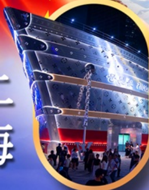
เรือคอะทูลยส์