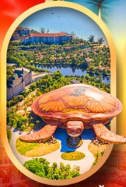
พิพิธภัณฑ์สัตว์น้ำ