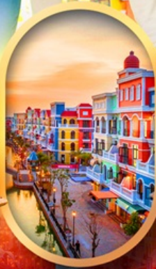
เวนิสแห่งเวียดนาม