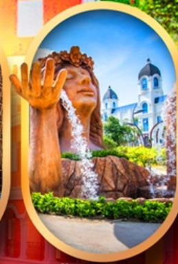
น้ำตกเทพพิหญิง