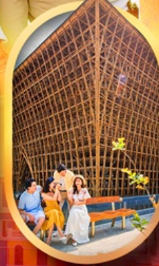
อาคารไม้ไผ่