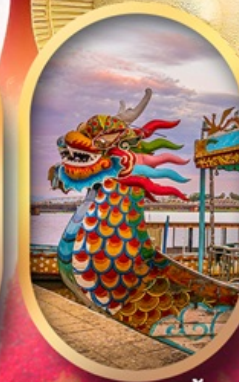
ล่องเรือมังกรแม่น้ำหอม