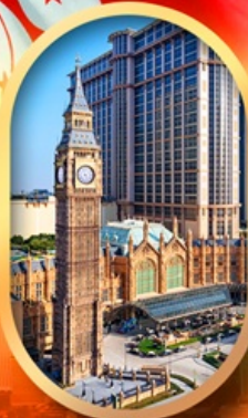
ลอนดอนเนอร์

เที่ยวคุ้ม!! บินเข้าฮ่องกง กลับมาเที่ยว บินเข้ากลับดีด