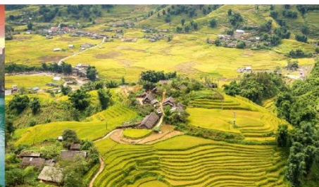
หมู่บ้านต้าฟาน

*กรณีห้องพักรับรองเปลี่ยน ขอสงวนสิทธิ์ในการเปลี่ยนวันเข้าพัก และปรับเปลี่ยนโปรแกรมโดยคำนึงถึงผลประโยชน์ลูกค้าเป็นสำคัญ