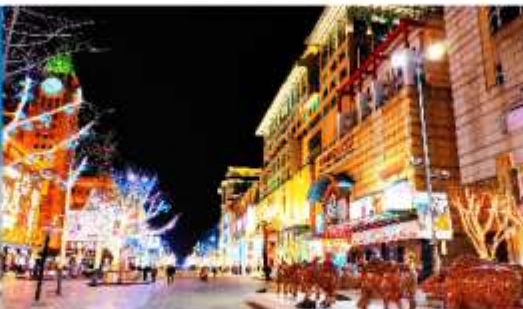
ถนนหวังฟูจิ่ง