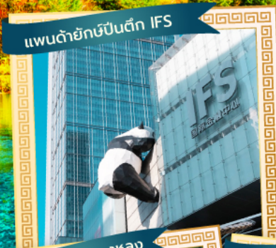
แพนด้ายักษ์ปิ่นตึก IFS