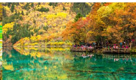
อุทยานแห่งชาติจิวจ้ายโกว

*ทางบริษัทฯ ขอสงวนสิทธิ์ในการสลับโปรแกรมทัวร์ตามความเหมาะสมขึ้นอยู่กับสถานการณ์ปฏิบัติงาน โดยคำนึงถึงผลประโยชน์ของลูกค้าเป็นสำคัญ