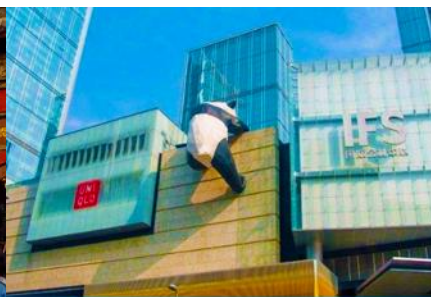
หมีแพนด้าปีนตึก ณ ตึก IFS