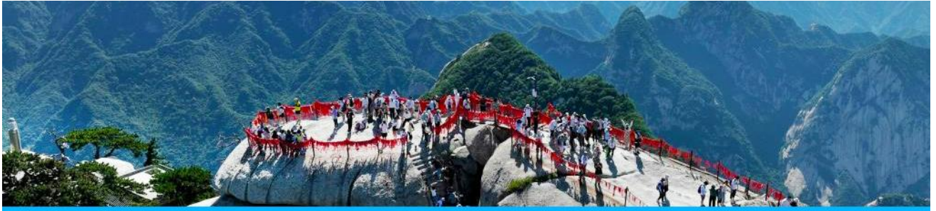
เขาหัวซาน

หลังอาหารให้ท่านพักผ่อนตามอัธยาศัยในโรงแรม