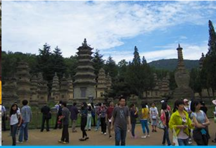
ป่าเจดีย์