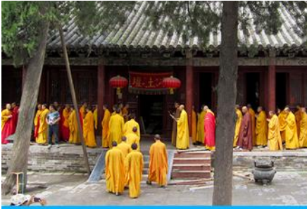
วัดเส้าหลิน