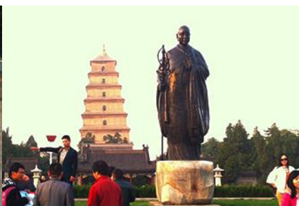
เจดีย์ห่านป่าใหญ่