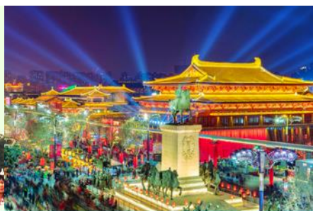
Nightless City of Great Tang