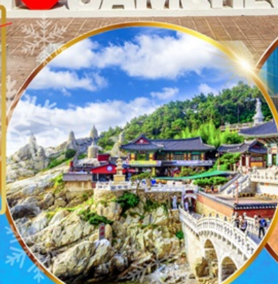
วัดแฮดงยงกุงซา