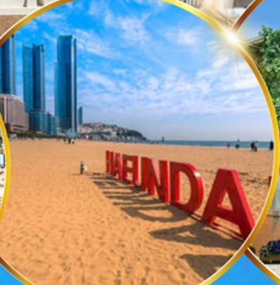
หาดแฮนแด