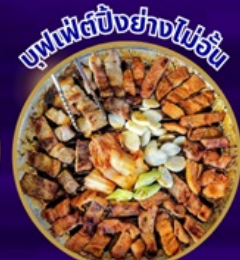
ซูฟเฟ็ตบั้งย่างโปรวัน