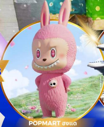
POP MART ฮงแด