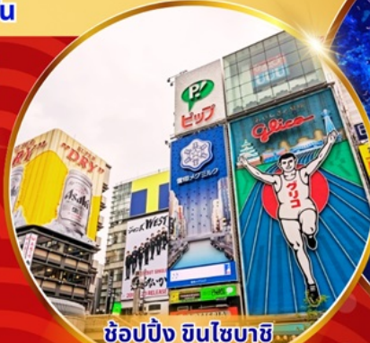
ซูปปิ้ง ซินโซบาชิ