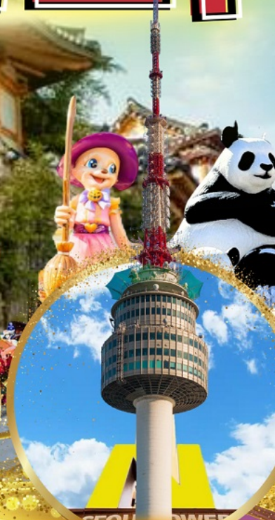
N Seoul Tower