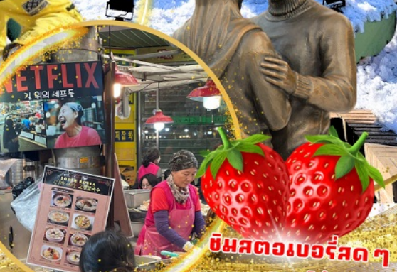
ตลาดกวางจง