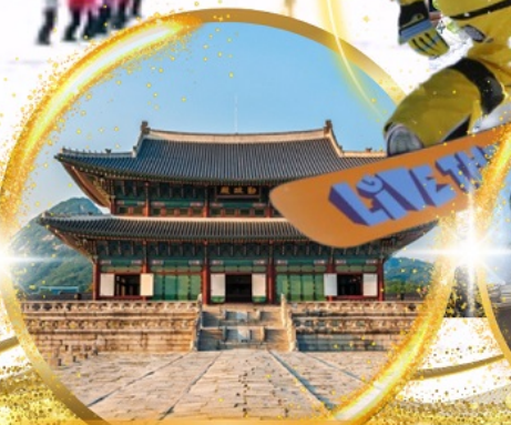
พระราชวังเคียงบกกรุง