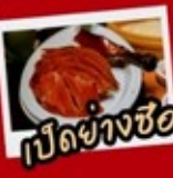
เป็ดย่างซีอาน