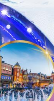
โรงงานช็อคโกแลต ชิโรอิ โคอิมีโตะ