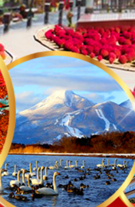
ทะเลสาบอินาวะชิโระ