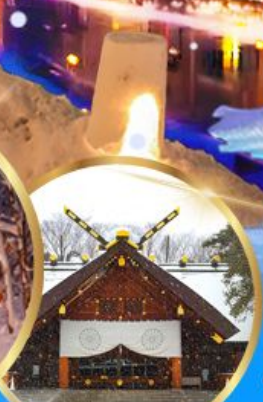
ศาลเจ้า ออกโทโต

เดินทาง 04 - 09 กุมภาพันธ์ 68 05 - 10 กุมภาพันธ์ 68