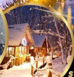
หมู่บ้านเทพนิยาย นิงเกิ้ลเทอร์ส