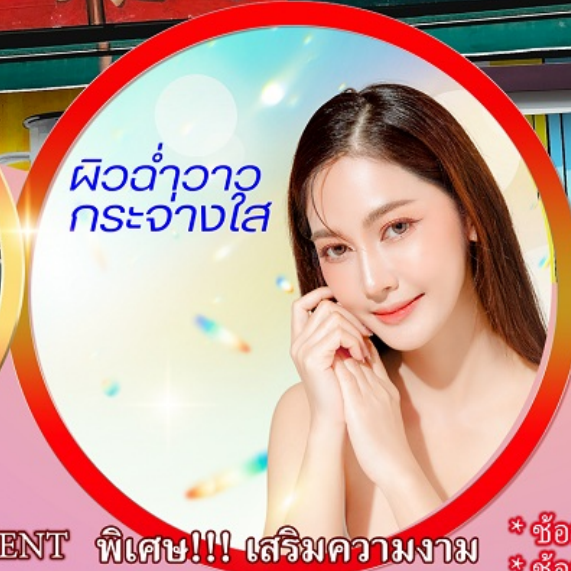
ผิวอ่าว กระจางใส