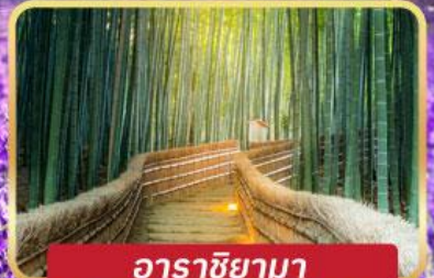
อาราชิยามา