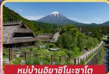
หมู่บ้านอิยาชิโนะซาโตะ