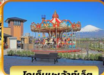
โทเก็มบะเจ้าท่เล็ต