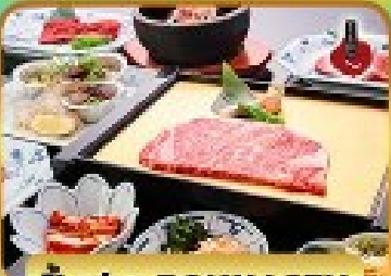
บั้งย่าง ROKKASEN