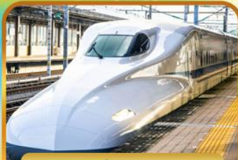
สั้มฟัสนั้งชึนกัันเซน