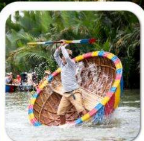
"ล่องเรือกระดิง"

นั่งกระเช้าที่ยาวที่สุดในโลก ขึ้นสู่บาน่าฮิลล์ • หมู่บ้านฝรั่งเศส • สวนสนุก FANTASY PARK LE JARDIN D'AMOUR • สะพานมือสีทอง • วัดหลินจิ้ง • เมืองโบราณฮอยอัน หมู่บ้านกิมถาน • ล่องเรือกระดิง • สะพานมังกร • APEC PARK • ตลาดฮาน