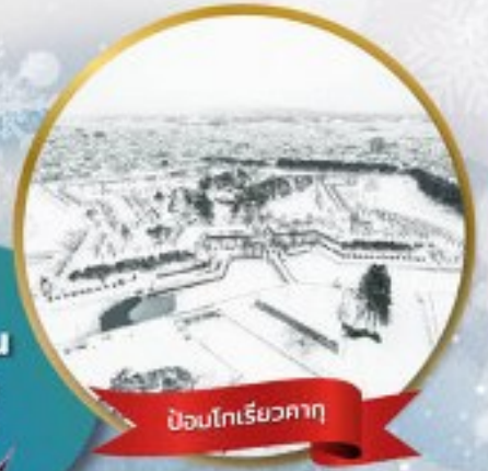
ป้อมโกเรียวกาคุ

หมู่บ้านนิงเกิลเกอเรส • สวนสัตว์อาซาฮิยาม่า • ชมขบวนพาเหรดเพนกวิน ตลาดเช้าฮาโกดาเตะ • ป้อมโกเรียวกาคุ • นั่งกระเช้าชมเมืองฮาโกดาเตะ ลานสกี • HILL OF BUDDHA • โฮตารุ • คลองโฮตารุ • หมู่บ้านราเมน