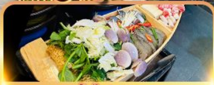
เมนูพิเศษ!! หม้อไฟทะเล