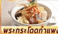
พระกระโดดกำแพง