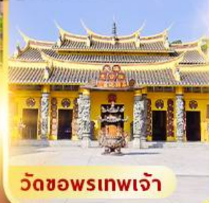
วัดขอพรเทพเจ้า