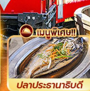
เมนูพิเศษ!! ปลาประดาน้ำริบตี