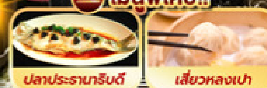
ปลาประจานทรัสต์