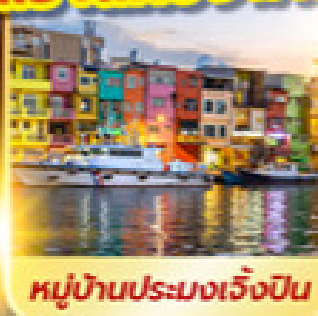
หมู่บ้านประมงเจิ้งปิ่น