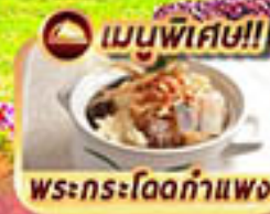
เมนูพิเศษ!! พระกระโดดกำแพง