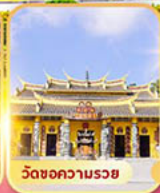
วัดหอความรอย