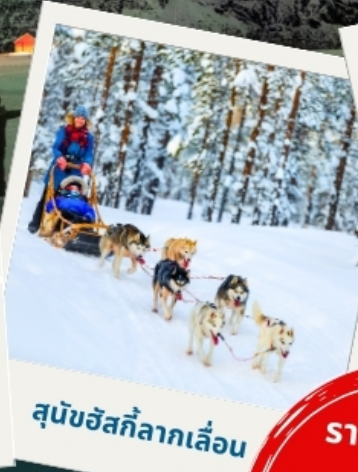
สุนัขฮัสกีลากเลื่อน