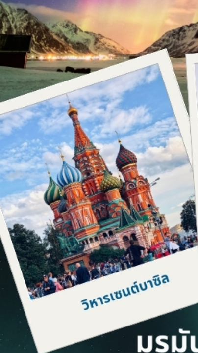
วิหารเซนต์บาซิล