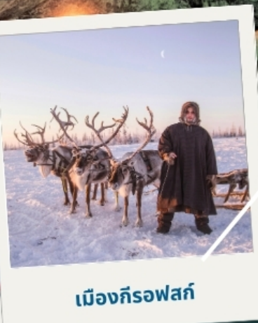
เมืองก็รอฟสค์