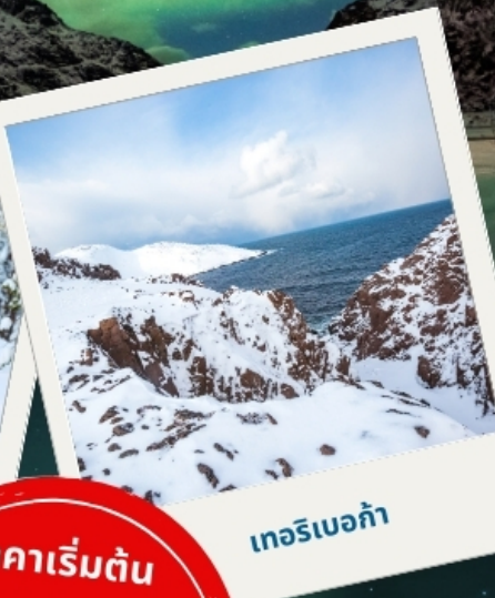
เทอริเบอก้า