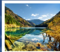
จี๋จ้ายโกว

อุทยานกุหลาบสีดรุณี / อุทยานชวงเฉียวโกว / ทะเลสาบเตี้ยซีไห่ / อุทยานแห่งชาติจี๋จ้ายโกว โชว์ทิเบต / เมืองโบราณซงพาน / ซอยกว้างแคบ / POP MART / ถนนคนเดินซอยกว้างแคบ