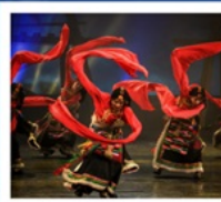
โชว์ทิเบต