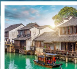
เมืองโบราณอูเจิ้น