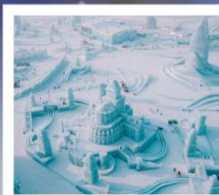
ICE AND SNOW FEST.