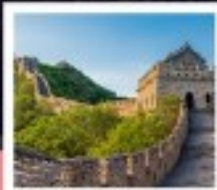
ท่าแพงเมืองจีน

ทัวร์คุณภาพ ไม่หลงร้านช้อปปิ้ง • ไม่ขายออฟชั่น