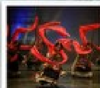
โรวี่ทิงตง