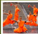
โซ่วเล่าหลิน

กำแพงเมืองโบราณซีอาน / วัดลามะ / ตลาดมุสลิม ป่าเจดีย์ / โซว์การแสดงวิทยายุทธเส้าหลิน / โซว์ราชวงศ์ถัง อุทยานหยุ่นโกซาน / ศาลเจ้ากวนอู / ถ้ำหินหลงเหมิน / วัดเส้าหลิน พิพิธภัณฑ์กองทัพใต้ดินทหารม้าจีนซี / ถนนคนเดินวัฒนธรรมต้าถิง