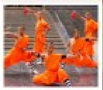
โชว์ราชวงศ์ถัง

PERIOD 1 : 9 - 14 สิงหาคม | PERIOD 2 : 18 - 23 ตุลาคม 2567