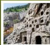
ถ้ำหินหลงเหมิน