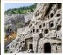
กำแพงหลงเหมิน