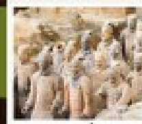
สุสานพันชี

วัดสำคัญ / ป่าหล่งตี้ / โรงละครแสดงวิทยายุทธสำคัญ / อุทยานหยุนโกซาน ศาลเจ้ากวนอู / กำแพงหลงเหมิน / สุสานทหารพันชี / ถนนคนเดินวัฒนธรรมต้าถิง โชว์ราชวงศ์ถัง / กำแพงเมืองโบราณซีอาน / วัดสาม / ตลาดมุสลิม