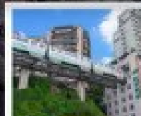
ต่าจู่เมืองเก่า

ทัวร์คุณภาพ ไม่ลงร้านฮ้อปปีง • ไม่ขายออฟชั่น