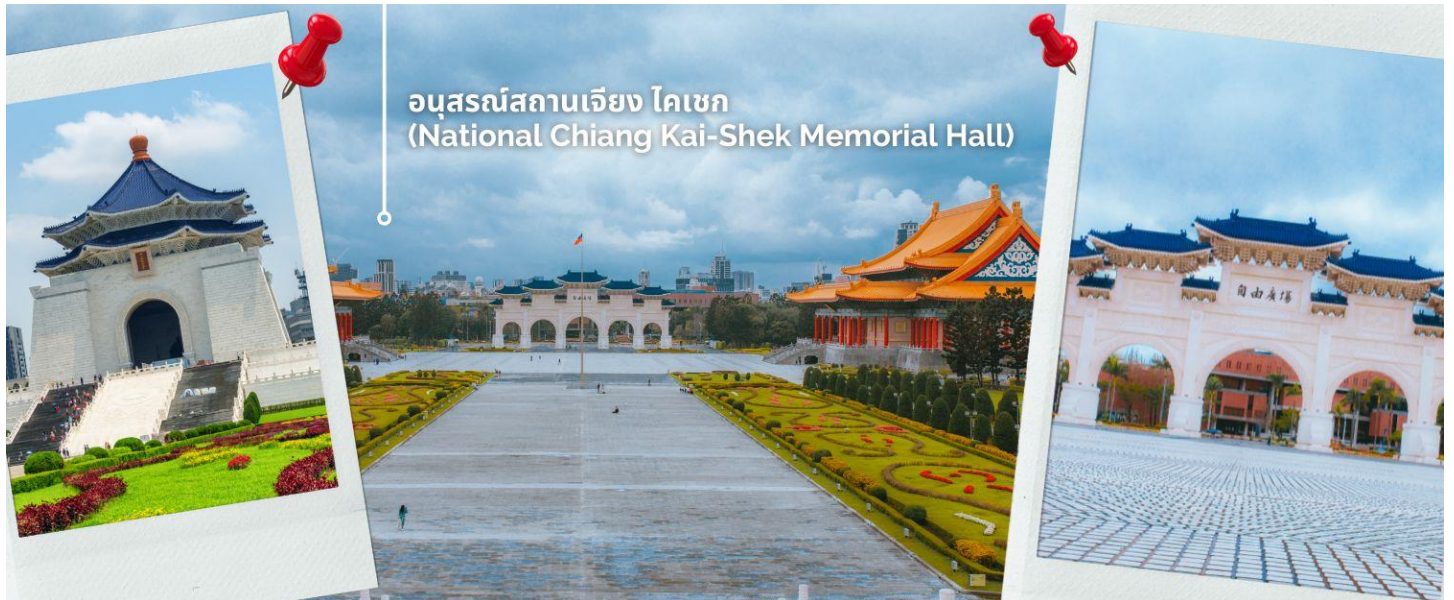
อนุสรณ์สถานเจียง ไคเชก (National Chiang Kai-Shek Memorial Hall)