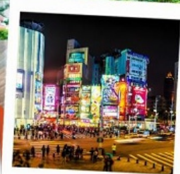
ตลาดซีหมินตง