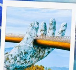
บาน่าฮิลล์