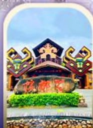
หมู่บ้านชนเผ่า