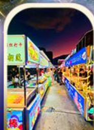
ตลาดอิหัง