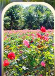
ทุ่งอ่าวย่าหลง