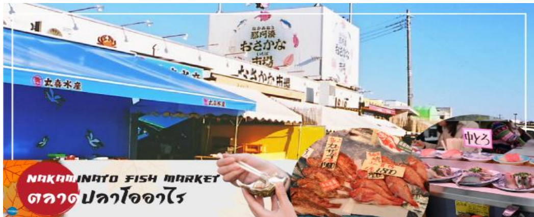
NAKAMINATO FISH MARKET ตลาดปลาโออาไร

08.10 น. เดินทางถึง ท่าอากาศยานนานาชาตินาริตะ ประเทศญี่ปุ่น หลังจากผ่านขั้นตอนศุลกากร เรียบร้อยแล้ว แล้ว (เวลาที่ญี่ปุ่น เร็วกว่าเมืองไทย 2 ชั่วโมง กรุณาปรับนาฬิกาของท่านเพื่อความสะดวกในการนัดหมายเวลา) ***สำคัญมาก!! ประเทศญี่ปุ่นไม่อนุญาตให้นำอาหารสดจำพวก เนื้อสัตว์ พืช ผัก ผลไม้ เข้าประเทศ หากฝ่าฝืนมีโทษปรับและจับหลังผ่านขั้นตอนการเข้าประเทศแล้ว นำท่านออกเดินทางสู่ จังหวัดอิบารากิ (Ibaraki) (ใช้เวลาเดินทางประมาณ 1.40 ชั่วโมง) ตั้งอยู่ในภูมิภาคคันโตของเกาะฮอนชู ประเทศญี่ปุ่น อิบารากิซึ่งอยู่ไม่ห่างจากโตเกียว เต็มไปด้วยสถานที่ท่องเที่ยวอันสวยงามมากมาย โดยเฉพาะเทศกาลที่เกี่ยวข้องกับดอกไม้ ที่มีให้ชมตลอดทั้งปี นอกจากนี้ยังเป็นจังหวัดที่มีการผลิตนัตโตะ หรือ ถั่วเน่าญี่ปุ่น มากที่สุดในญี่ปุ่นอีกด้วย จากนั้นออกเดินทางสู่ ตลาดปลาโออาไร (Oaraicho) ท่านสามารถชิมอร่อยกับอาหารทะเลสดใหม่ส่งตรงมาจากท่าเรือประมงโออาไร อาทิ ข้าวหน้าปลาดิบ หรืออาหารทะเลปิ้งย่าง นอกจากนี้ยังมีอาหารทะเลตากแห้งที่ทำเองโดยชาวประมง ซึ่งเหมาะสำหรับเป็นของฝากอีกด้วย อิสระรับประทานอาหารทะเลสดๆ แบบปิ้งย่าง เพลิดเพลินกับหลากหลายเมนู ปลาสดๆ เช่น ปลาอังโค ปลาชิราสุ (ปลาข้าวสาร) ตามแต่ฤดูกาล หอยเชลล์ หอยตลับ หอยนางรม หมึกย่างเนย และกุ้ง เป็นต้น