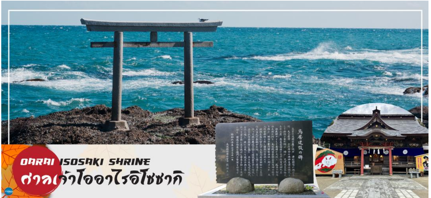
OARAI ISOSAKI SHRINE ศาลเจ้าโออาไรอิโซซากิ

08.10 น. เดินทางถึง ท่าอากาศยานนานาชาตินาริตะ ประเทศญี่ปุ่น หลังจากผ่านขั้นตอนศุลกากร เรียบร้อยแล้ว แล้ว (เวลาที่ญี่ปุ่น เร็วกว่าเมืองไทย 2 ชั่วโมง กรุณาปรับนาฬิกาของท่านเพื่อความสะดวกในการนัดหมายเวลา) ***สำคัญมาก!! ประเทศญี่ปุ่นไม่อนุญาตให้นำอาหารสดจำพวก เนื้อสัตว์ พืช ผัก ผลไม้ เข้าประเทศ หากฝ่าฝืนมีโทษปรับและจับหลังผ่านขั้นตอนการเข้าประเทศแล้ว นำท่านออกเดินทางสู่ จังหวัดอิบารากิ (Ibaraki) (ใช้เวลาเดินทางประมาณ 1.40 ชั่วโมง) ตั้งอยู่ในภูมิภาคคันโตของเกาะฮอนชู ประเทศญี่ปุ่น อิบารากิซึ่งอยู่ไม่ห่างจากโตเกียว เต็มไปด้วยสถานที่ท่องเที่ยวอันสวยงามมากมาย โดยเฉพาะเทศกาลที่เกี่ยวข้องกับดอกไม้ ที่มีให้ชมตลอดทั้งปี นอกจากนี้ยังเป็นจังหวัดที่มีการผลิตนัตโตะ หรือ ถั่วเน่าญี่ปุ่น มากที่สุดในญี่ปุ่นอีกด้วย จากนั้นออกเดินทางสู่ ตลาดปลาโออาไร (Oaraicho) ท่านสามารถชิมอร่อยกับอาหารทะเลสดใหม่ส่งตรงมาจากท่าเรือประมงโออาไร อาทิ ข้าวหน้าปลาดิบ หรืออาหารทะเลปิ้งย่าง นอกจากนี้ยังมีอาหารทะเลตากแห้งที่ทำเองโดยชาวประมง ซึ่งเหมาะสำหรับเป็นของฝากอีกด้วย อิสระรับประทานอาหารทะเลสดๆ แบบปิ้งย่าง เพลิดเพลินกับหลากหลายเมนู ปลาสดๆ เช่น ปลาอังโค ปลาชิราสุ (ปลาข้าวสาร) ตามแต่ฤดูกาล หอยเชลล์ หอยตลับ หอยนางรม หมึกย่างเนย และกุ้ง เป็นต้น