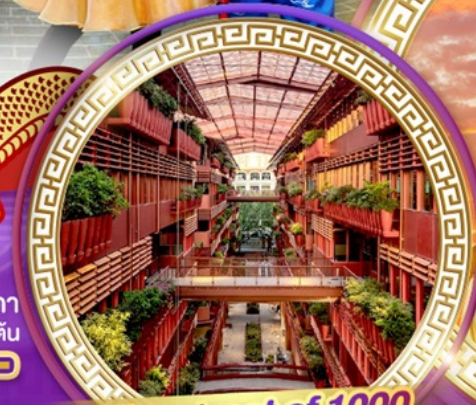
The street of 1000 red jars