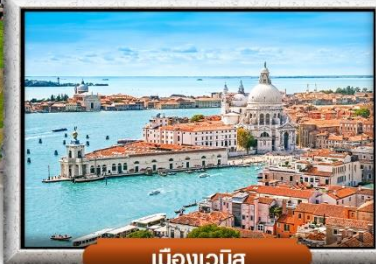
เมืองเวนิส