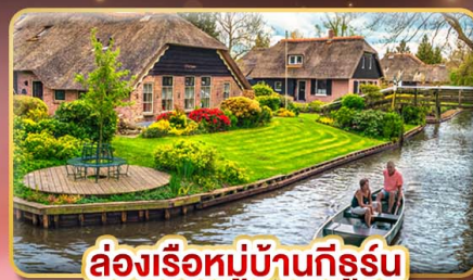
ล่องเรือหมู่บ้านที่รูร์น