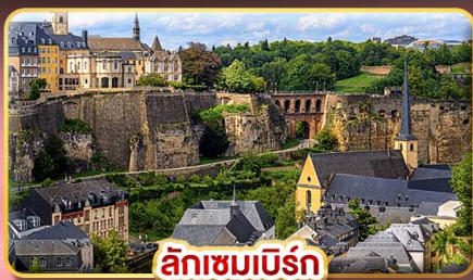
ลักเซมเบิร์ก