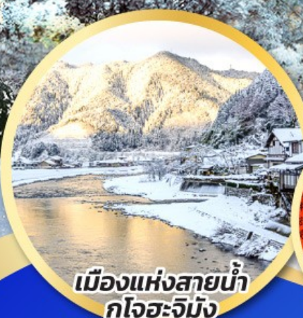
เมืองแห่งสายน้ำ กุโจะจิมัง