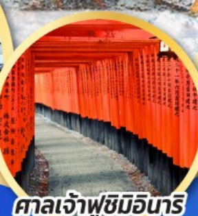
ศาลเจ้าฟุชิมิอินาริ