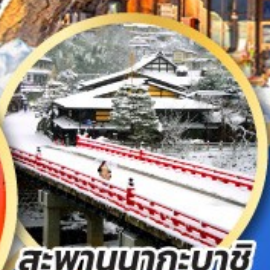
สะพานนากะบาชิ

ชมเมืองแห่งสายน้ำ บรรยากาศย้อนยุค "กุโจะจิมัง"