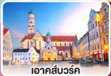
เอาคส์บวร์ค