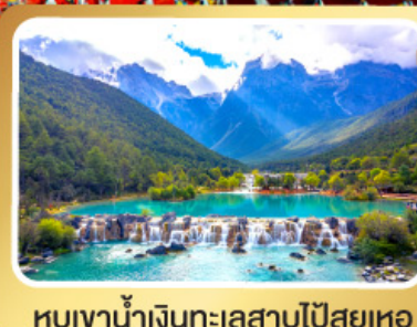
หุบเขาน้ำเงินทะเลสาบไป๋สฺยเหอ