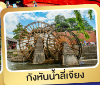
กังหันน้ำลี่เจียง