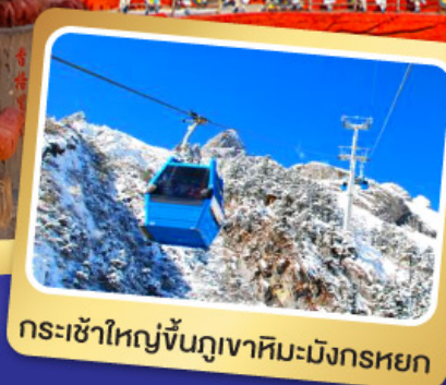
กระเช้าใหญ่ขึ้นภูเขาหิมะมังกรหยก